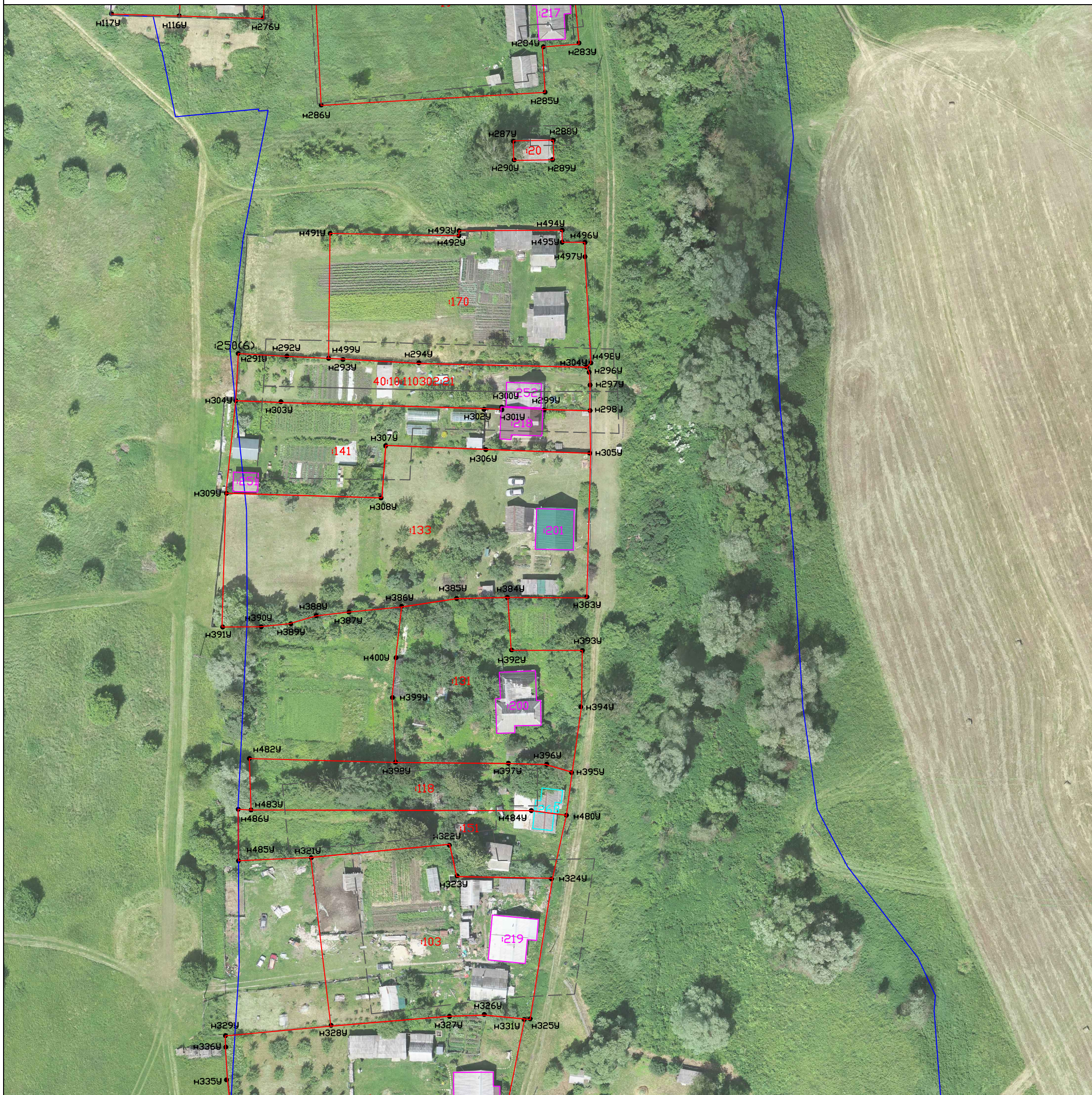
Схема границ земельных участков

Масштаб 1:1000 Система координат: МСК-40 1 зона