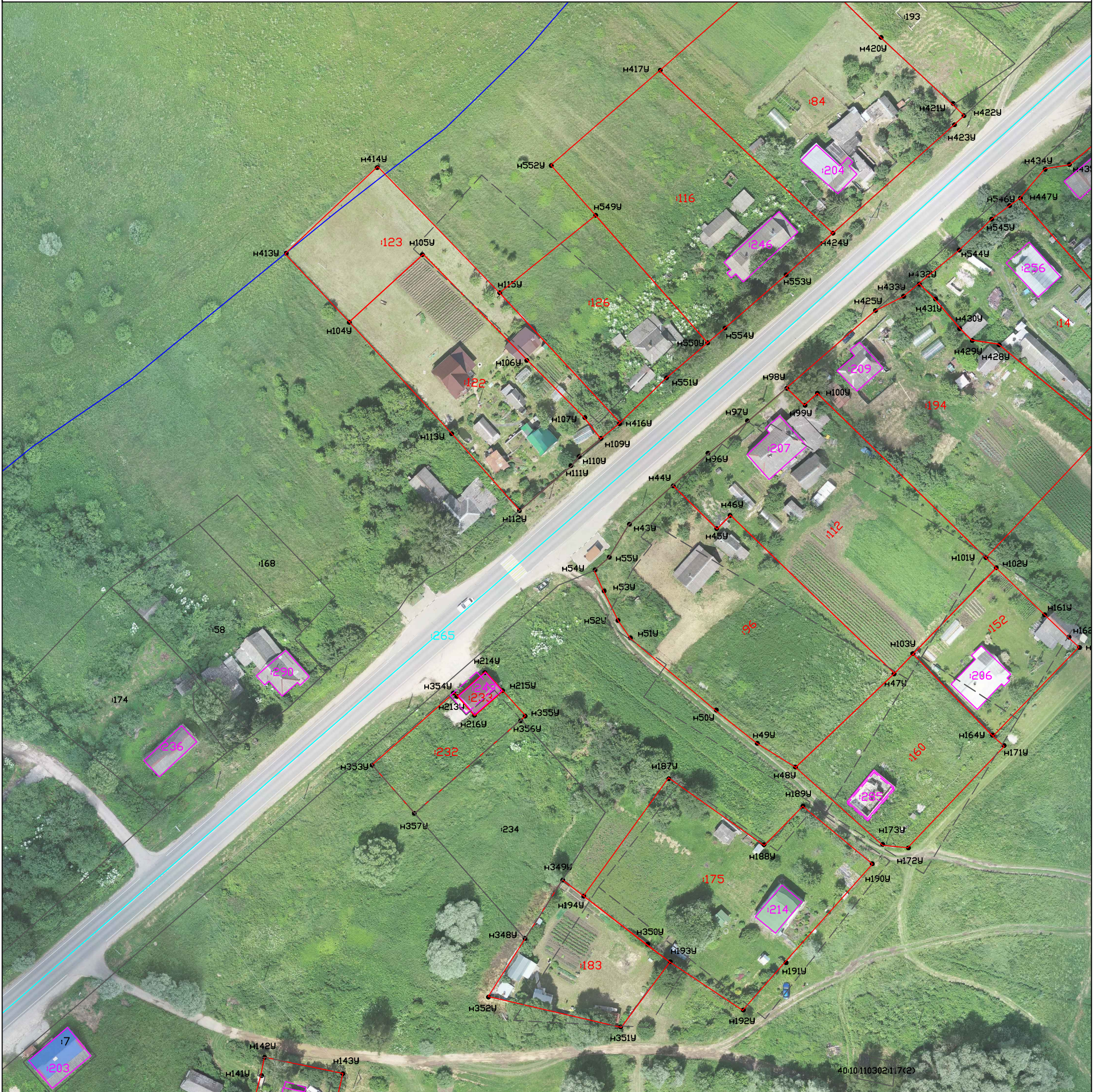
Схема границ земельных участков

Масштаб 1:1000 Система координат: МСК-40 1 зона