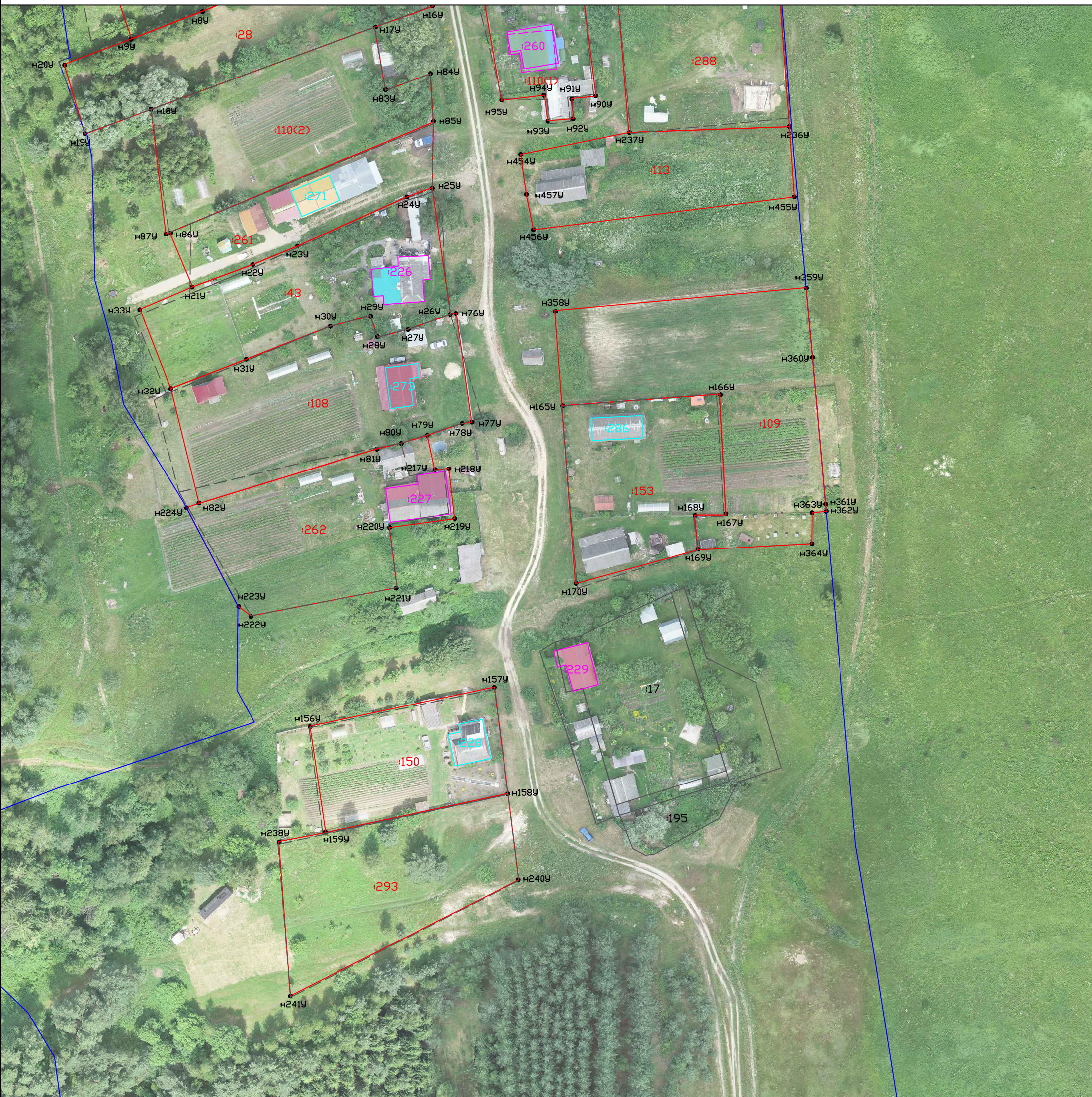
Схема границ земельных участков

Масштаб 1:1000 Система координат: МСК-40 1 зона