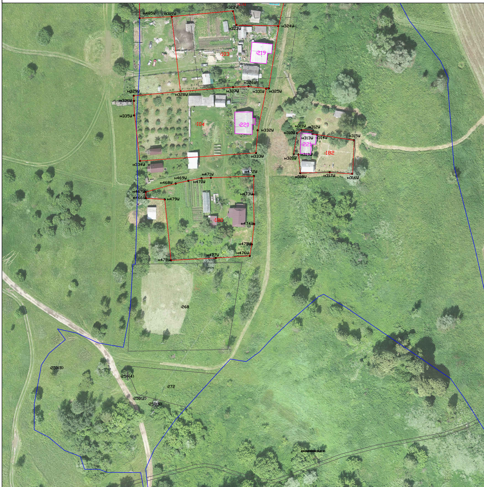
Схема границ земельных участков

Масштаб 1:1000 Система координат: МСК-40 1 зона