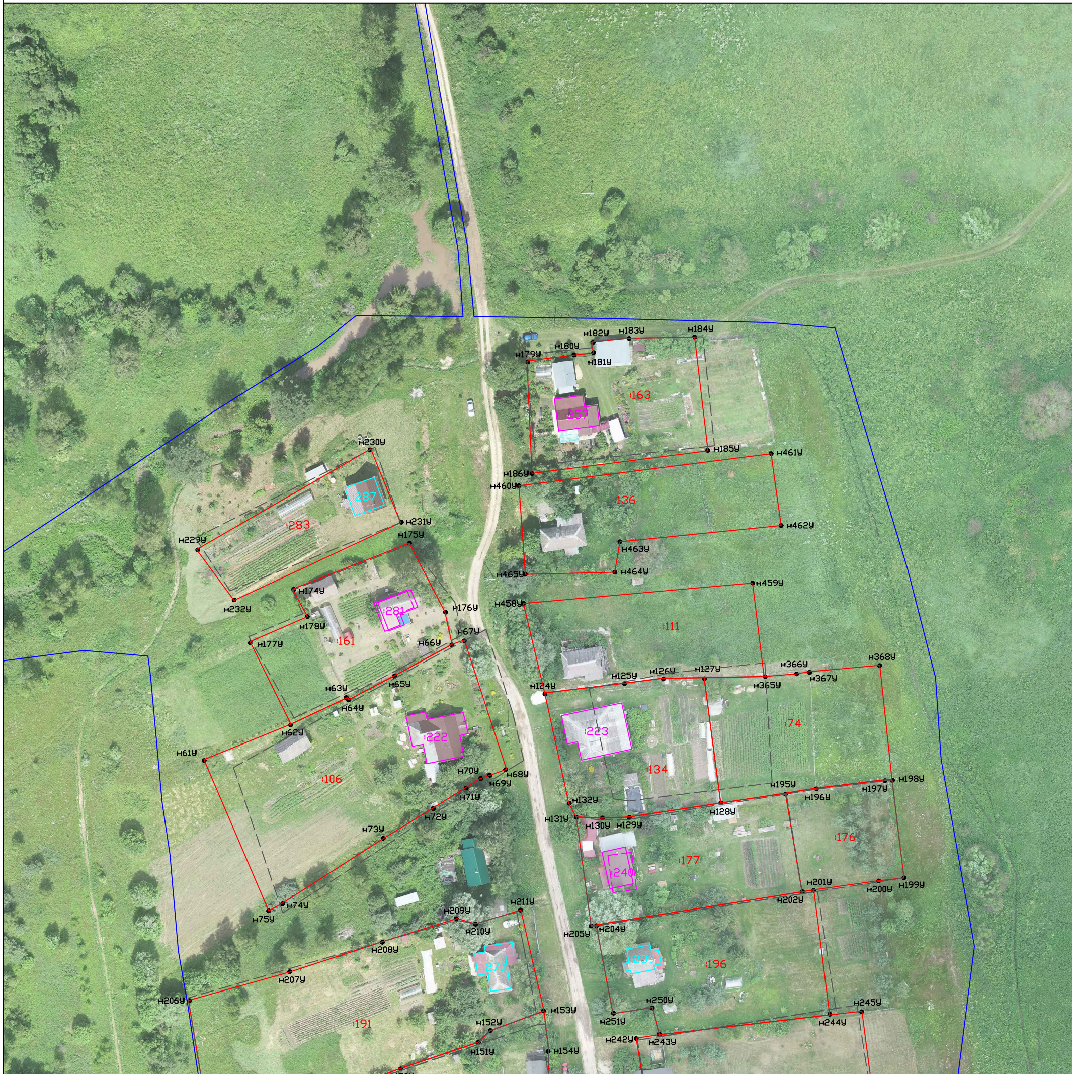
Схема границ земельных участков

Масштаб 1:1000 Система координат: МСК-40 1 зона